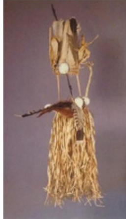
Head Ornament, Tabiteuea, Kiribati, Leipzig, Museum für Völkerkunde